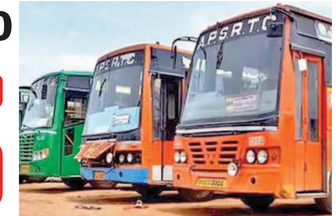
అదనంగా 7,200 సంక్రాంతి బస్సులు

ఆర్టీసీ నిర్ణయం విజయవాడ, జనవరి 7 ప్రభాతవార్త ప్రతినిధి: సంక్రాంతి పండుగ సందర్భంగా ప్రయాణికులకు ఏపీ ఆర్టీసీ శుభవార్త చెప్పింది. తెలంగాణ, ఆంధ్ర ప్రదేశ్ ప్రాంతాల నుంచి ఏపీ ఆర్టీసీ వివిధ గ్రామాలకు వచ్చే ప్రయాణికుల కోసం ప్రత్యేకంగా బస్సులను నిర్వహించే నిర్ణయం తీసుకుంది. పండుగ రద్దీ దృష్ట్యా 7,200 అదనపు బస్సులు నడపాలని ఏపీ ఆర్టీసీ నిర్ణయం తీసుకుంది. తెలంగాణ, ఆంధ్ర ప్రదేశ్ ప్రాంతాలకు ప్రత్యేక బస్సులు నడపాలని నిర్ణయం తీసుకున్నారు. బుధవారం నుంచి ఈ నెల 13వ తేదీ వరకు అదనపు బస్సులు నడపనున్నారు. హైదరాబాద్ నుంచి వచ్చే బస్సులు 2,153 బస్సులు అర్టీసీ నడపనుంది. బెంగళూరు నుంచి వచ్చే బస్సులు 375 బస్సులు అర్టీసీ నడపనున్నారు. విజయవాడ నుంచి 300 అదనపు బస్సులు నడపనున్నారు. తిరుగు ప్రయాణాలకు ఈ నెల 16 నుంచి 20 వరకు 3,200 ప్రత్యేక బస్సులను నడపనున్నారు. ప్రత్యేక బస్సుల్లో ఎలాంటి అదనపు ఛార్జీలు ఉండవని ఆర్టీసీ ఎంపీ తెలిపారు. సాధారణ బస్సు ఛార్జీల ప్రత్యేక బస్సుల్లో ఉంటాయన్నారు. ప్రత్యేక బస్సుల్లో ముందస్తు టికెట్ బుకింగ్ చేసుకునే సౌకర్యం ఉందని, ఒకేసారి రెండువైపులా టికెట్ బుక్ చేసుకుంటే 10 శాతం రాయితీ ఇస్తామని తెలిపారు. ఆర్టీసీ బస్సుల్లో సురక్షితమైన, సౌకర్యవంతమైన ప్రయాణం కల్పిస్తున్నట్లు తెలిపారు. ప్రయాణికుల రద్దీకి అనుగుణంగా ఎక్కడిక్కడ ఏర్పాటు చేశామన్నారు. ఇదే సందర్భంలో సంక్రాంతి పండుగ సందర్భంగా సాంఘికంగా వెళ్ల వారికి ప్రత్యేక బస్సులను నడిపిస్తున్నట్లు టిబెట్ ఆర్టీసీ ప్రకటించింది. గత ఏడాది సంక్రాంతి పండుగ సందర్భంగా 4,484 ప్రత్యేక బస్సులను పైన్ చేయగా ప్రయాణికుల రద్దీకి అనుగుణంగా 5,246 బస్సులను సంస్కరించారు. గత సంక్రాంతి అనుభవం దృష్ట్యా ఈసారి 6,432 >>2