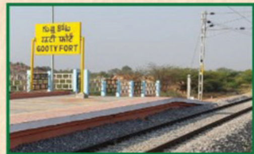
323 కి.మీ.ల - 3 రైల్వే లైన్లు (2 రాయలసీమ ప్రాజెక్టులు) రూ. 5,718 కోట్లు