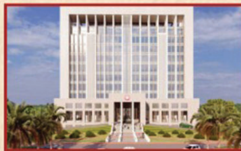
విశాఖ కేంద్రంగా దక్షిణ కోస్తా రైల్వే జోన్ ప్రధాన కార్యాలయ నిర్మాణం - రూ. 149 కోట్లు