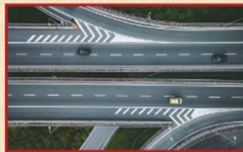
రోడ్ల నిర్మాణం/విస్తరణ (10 ప్రాజెక్టులు) రూ. 4,593 కోట్లు