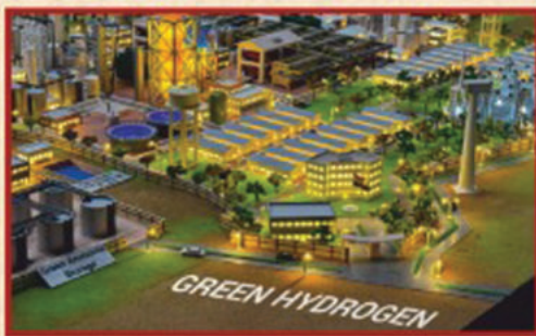
పూడిమడక దగ్గర NTPC గ్రీన్ హైడ్రోజన్ హబ్ రూ. 1,85,000 కోట్లు