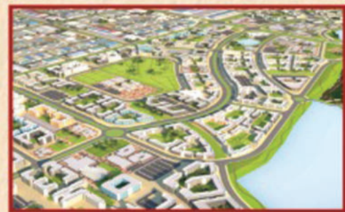
కృష్ణపట్నం పారిశ్రామిక పార్క్ రూ. 2,139 కోట్లు