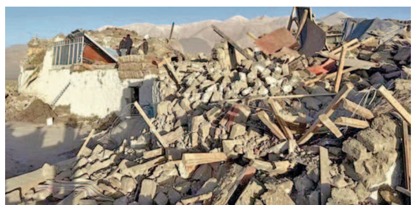
టిబెట్ ప్రాంతంలో భూకంపానికి వల ఇళ్లు ధ్వంసమైన దృశ్యం

ముప్పై ఆక్రమ కేసులు పెట్టారన్నారు. రాష్ట్రంలో భూ సమస్యలు వివరంగా ఉన్నాయన్నారు. వైఎస్సార్ పాలనలో భూకట్టాలు, 22వోల్ వేర్పాటు, రికార్డులు తారుమారు చేశారన్నారు. తమ ప్రభుత్వం రీసర్వే ద్వారా రైతుల భూ సమస్యలకు పరిష్కారం చూపుతామని పేర్కొన్నారు. త్వరలోనే తాను ప్రభుత్వ కార్యాలయాల్లో ఆకస్మిక తనిఖీలు చేపడతానని ప్రకటించారు. అధికారులు తప్పు చేయవద్దని సూచించారు. నదుల అనుసంధానం గేమ్ ఫేజర్: రాష్ట్రంలో నదుల అనుసంధానం గేమ్ ఫేజర్ గా మారబోతోందని సిఎం చంద్రబాబు పేర్కొన్నారు. రాష్ట్రంలోని అన్ని ప్రాంతాల్లో సేకరించేలా చర్యలు తీసుకుంటున్నట్లు పేర్కొన్నారు. నదుల అనుసంధానంతో వృధాగా సముద్రానికి వెళ్ల 300 బిలియన్ల నీటిని అందుబాటులో తెచ్చాలని దేశానికి కృషి చేస్తున్నట్లు తెలిపారు. గోదావరి - పెన్నా నదుల అనుసంధానం చేస్తే బలికపర్ల ద్వారా రామలక్ష్మణుని హృద్-నీవా, గాలి-నగరి, నెల్లూరు జిల్లాలలోని >>2